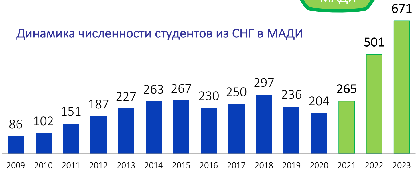
Динамика численности студентов из СНГ в МАДИ